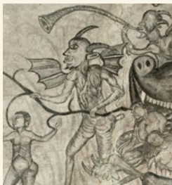
Peinture église de Vielle-Louron