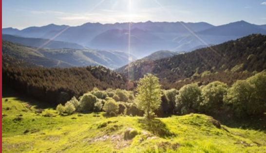
Panorama depuis la hourquette d'Ancizan