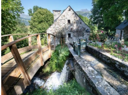
Moulin de la Mousquère de Sailhan