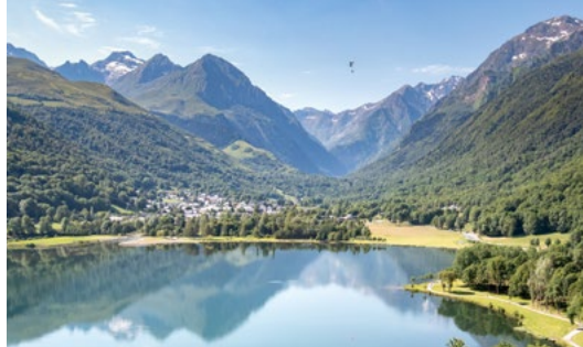
Lac de génos - Loudenvielle