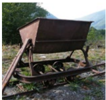
Wagon d'ardoisière à Génos