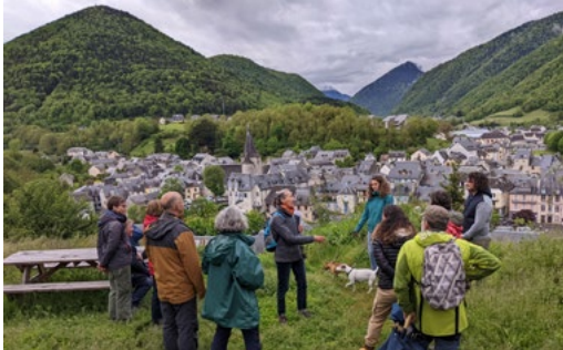
Visite du village d' Arreau