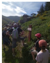
Rando Arreau- Jézeau