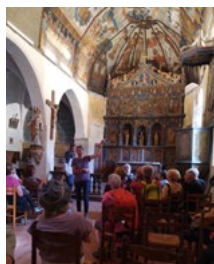
Église de Jézeau