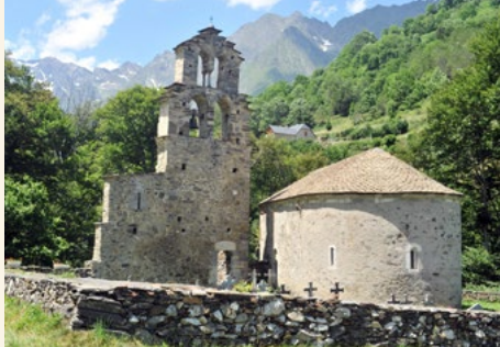
Chapelle des Templiers à Aragnouet