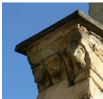
Église de Pourchergues