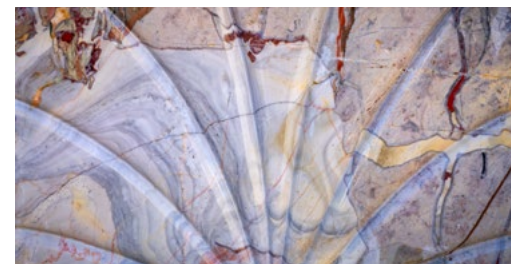
Fontaine en marbre à Ilhet