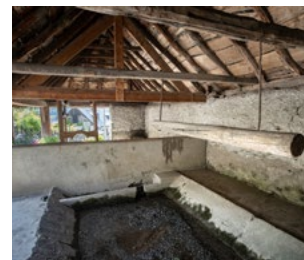
Lavoir & ferroir à Bourisp