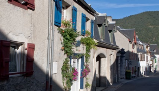
Village de Guchen