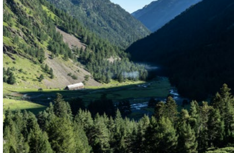
Hospice du Rioumajou