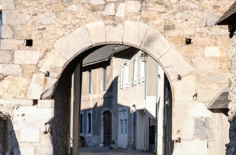
Porte Sainte-Quitterie de Sarrancolin