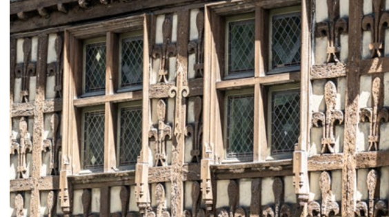
Maison des Lys d'Arreau